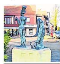
De originele 'Dorpswachters'.

Grote zwier . Twee van die beelden werden al beschadigd. Eind juni werd Grote zwier van zijn sokkel geduwd en beschadigd. Begin januari werd de vrouwenfiguur van De dorpswachters onthoofd. Nu